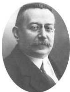
Figura 5.5: Enric Prat de la Riba

con unos elementos comunes que configuran su identidad colectiva, tales como lengua, historia, costumbres, tradiciones y, en el siglo XIX y parte del siglo XX, raza y religión. Toda nación tiende a poseer su propia organización política o Estado.