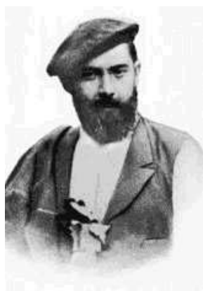
Figura 5.6: Sabino Arana

En 1906 se creó la Solidaritat Catalana , una coalición liderada por la Lliga regionalista, a la que acompañaban carlistas y republicanos catalanistas. Consiguieron un gran éxito electoral en las elecciones a Cortes de 1907 (41 de 44 escaños) y ayudó al dominio político de la Lliga en Cataluña.