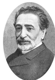
Figura 5.1: Práxedes Mateo Sagasta

El carácter del turno deriva de la alternancia de los dos partidos dinásticos en el gobierno. En la práctica, esta alternancia se construyó sobre el fraude electoral y el caciquismo.