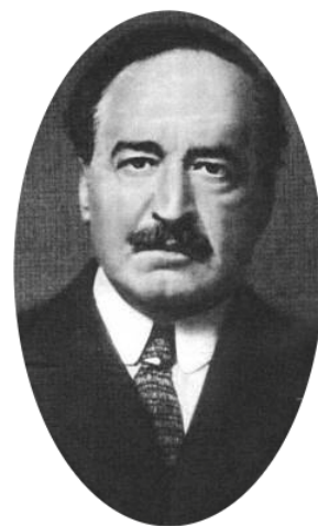
Figura 5.3: Vicente Blasco Ibáñez