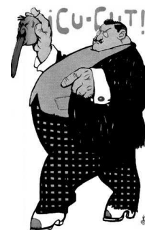
Figura 5.2: Alejandro Lerroux

Después de su derrota en la 3ª guerra carlista (1872–1876), el movimiento carlista se escindió en dos corrientes: integristas (1888, partido de Ramón Nocedal,) y jaimistas. El Jaimismo defiende al pretendiente Jaime de Borbón, hijo de Carlos VII. Consiguió nueve diputados en 1918, gracias a que aceptó el sistema de la Restauración con un programa ideológico moderado basado en el tradicionalismo católico, el foralismo —que llegaba incluso a posiciones autonomistas—, la representación corporativa y la negación de la vía insurreccional.