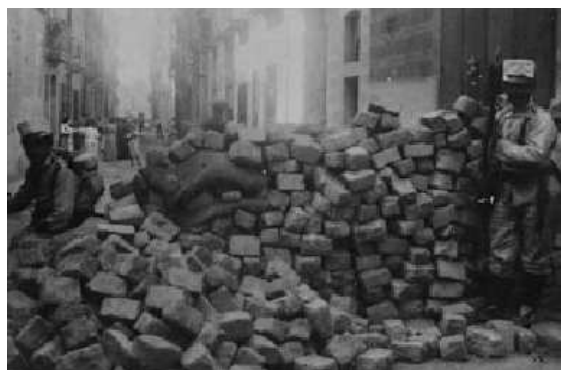
Figura 5.10: Semana Trágica (1909)