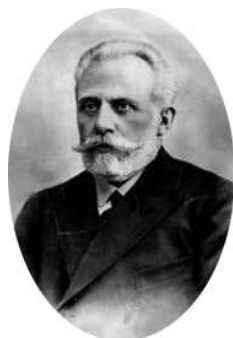
Figura 5.7: Pablo Iglesias

Para defender a los trabajadores de la explotación a la que se les sometía, nació el movimiento obrero, canalizado en dos frentes de lucha: la demanda de mejoras laborales, en manos de los sindicatos y la vía de los partidos políticos para acceder al gobierno, tanto por los caminos legales de participación en las elecciones como mediante la revolución.