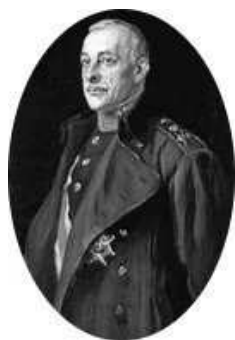
Figura 5.11: Miguel Primo de Rivera