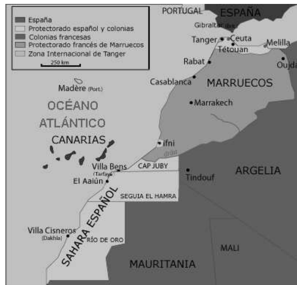
Figura 5.4: Colonias españolas